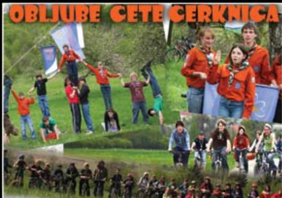
Cerknica 1 - obljuje