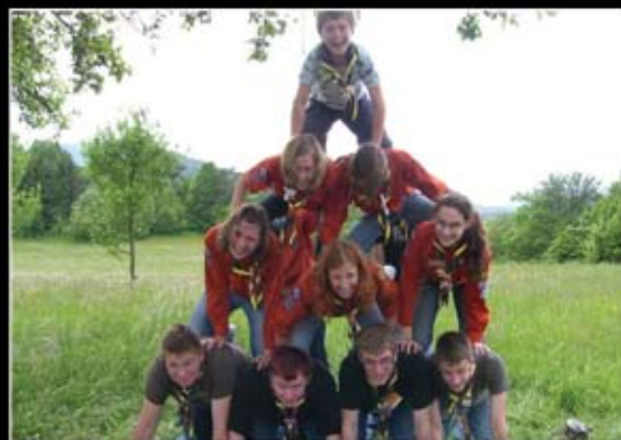
Skofljica 1 obljube-piramida