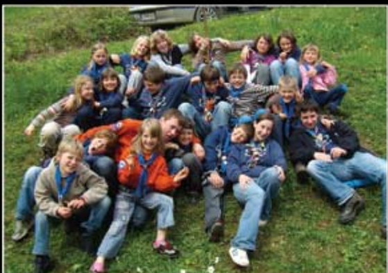
Obljuje - Ziri 1