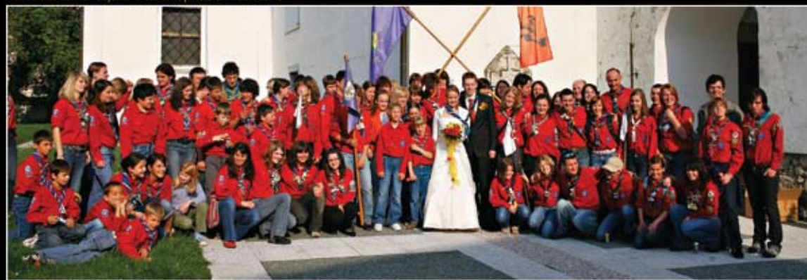
Petra- šentjernej 1 in Domen- Breznica 1