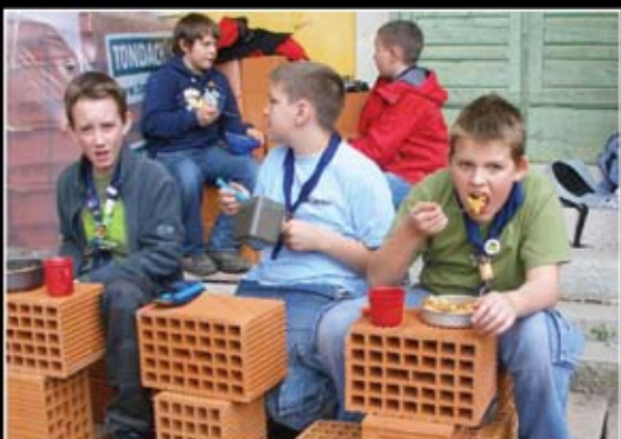
Skavt se znaide, obljuje, Ljubljana 3