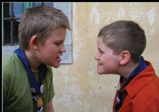
Grimasi dvoboj, VV obljuje, Ljubljana 3