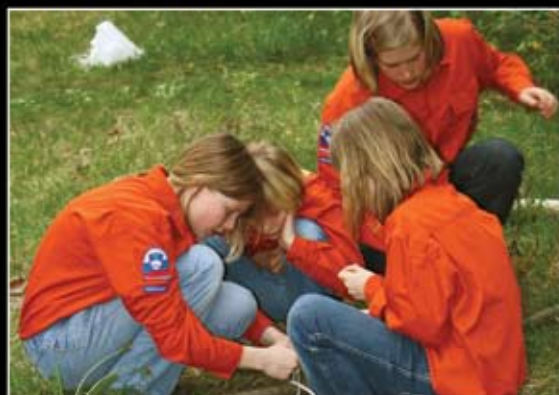
Priprave na izpit - Radovljica 1