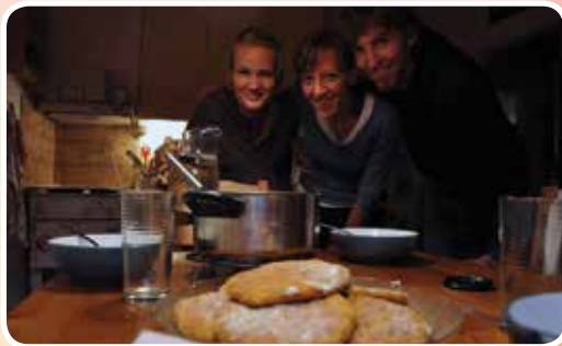
Piia s Finske je bila tudi odlična kuharica.

Seveda pa je to le ena stran couchsurfinga. Druga je ta, da si pripravljen oddati tudi svoj kavč neznanim ljudem, da jim odpreš svoja vrata in jim posvetiš svoj čas, da jim kaj razkažeš. Kljub temu, da Žalec, kjer trenutno stanujemo, ni najljubša izbira tujih turistov, sem imela že dvakrat možnost gostiti couchsurferje tudi pri nas doma.