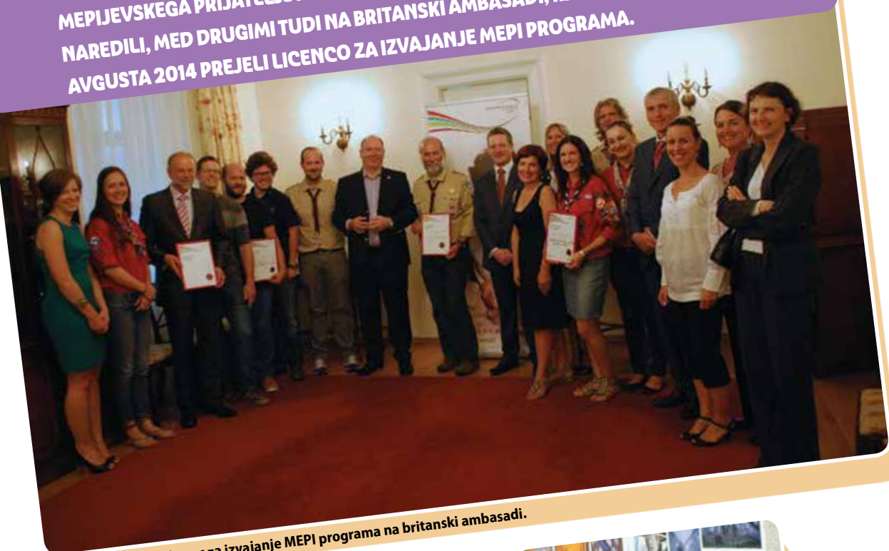
Prejemniki licenc za izvajanje MEPI programa na britanski ambasadi.

MINILO JE DOBREGA POL LETA OD POMLADI, KO SMO NA PROJEKTU »MEPI V VSAK STEG« PRIŽGALI MOTORJE IN SE ZAPELJALI PO POTI SKAVTSKO-MEPIJEVSKEGA PRIJATELJSTVA. VELIKO KONKRETNIH POSTAJ SMO ŽE NAREDILI, MED DRUGIMI TUDI NA BRITANSKI AMBASADI, KJER SMO 13. AVGUSTA 2014 PREJELI LICENCO ZA IZVAJANJE MEPI PROGRAMA.