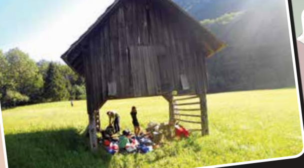
Prebudilo nas je sonce, PP tabor, Vrhnika 1