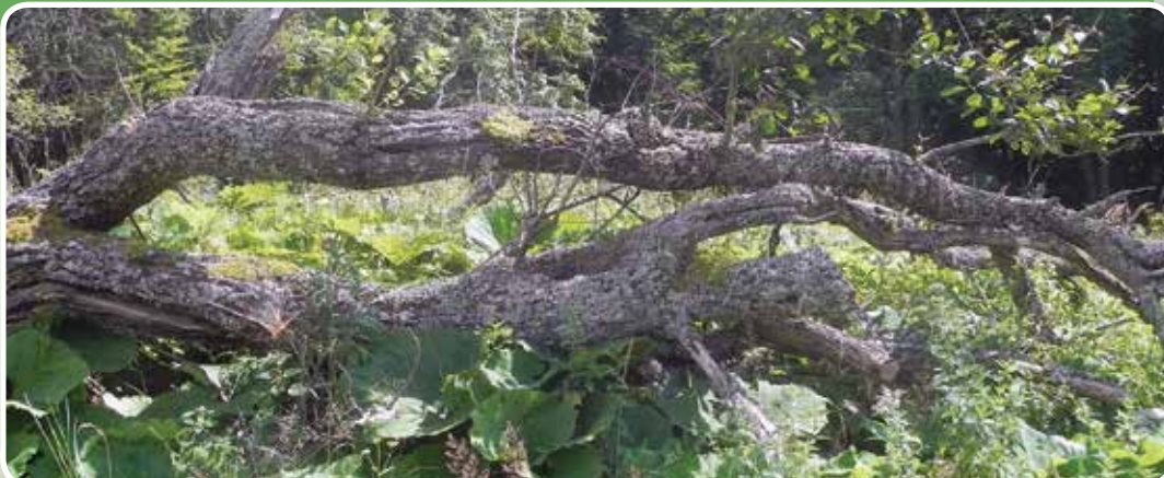
To drevo še živi

Gozdna učna pot Skavtek je nastala v sklopu mednarodnega projekta V naravi sem doma, ki ga je finančno podprla Švica in je bil zaključen v letu 2013. V tem projektu je sodelovala ekipa SOC, v njej pa so tudi vodiči, ki vodijo obiskovalce po gozdni učni poti Skavtek.