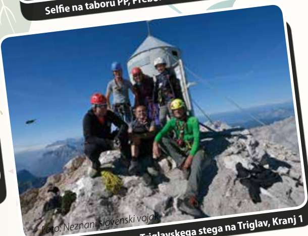
Na 2864 m, 2. vzpon Triglavskega stega na Triglav, Kranj 1