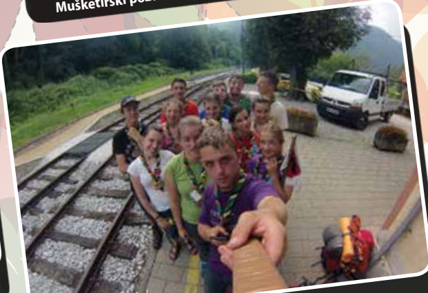
Selfie na taboru PP, Prebold - Polzela 1