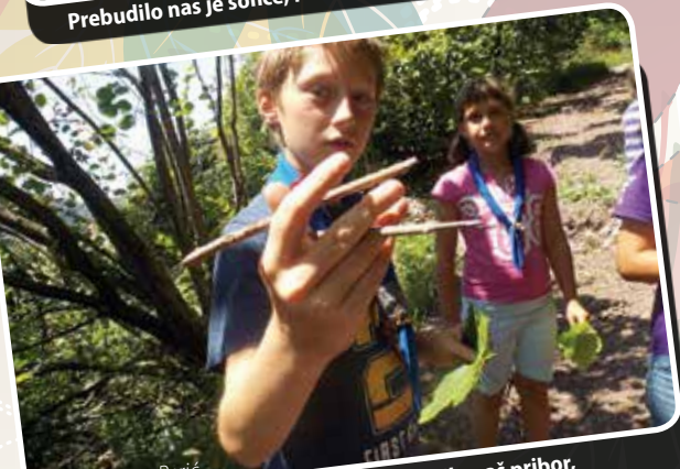
Kitajske palčke, ker je morje odplavilo naš pribor, poletni tabor VV, Sv. Katarina, Žiri 1