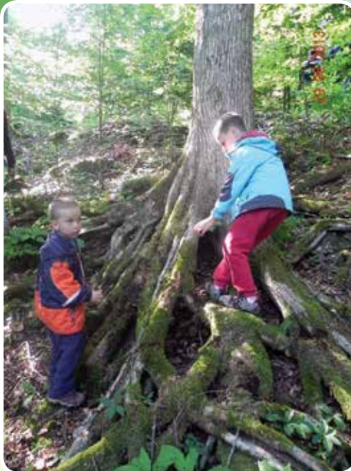
Bomo našli palčke?

tekla železniška proga, res? Da, tu sredi kočevskih gozdov. Na eni izmed točk poti ugibamo, ali je lipovec mož od lipe, drugje občudujemo drevo, ki se nam zdi že mrtvo, pa vendarle še živi. Potopimo se v morje lapuhovih klobukov,