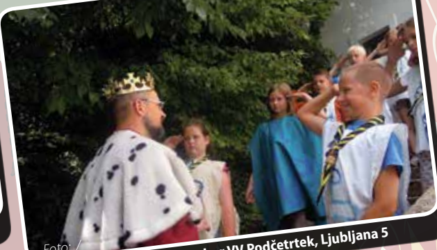
Mušketirski pozdrav, tabor VV Podčetrtek, Ljubljana 5