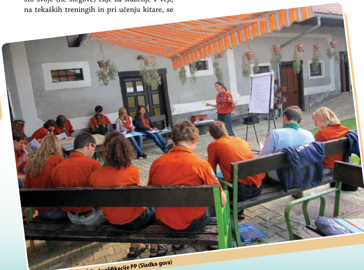
Predstavitve na TŠ Prekvalifikacije PP (Sladka gora)

tvoje delovanje dvigne na višji nivo. Skavtski voditelji odkrivajo sebi lastne, konkretne cilje znotraj splošnega skavtskega voditeljstva, obnavljajo svoje želje po novih znanjih (marsikdo se je nazadnje veččinsko izpopolnjeval v četi) in potegnejo na površje skrb za zdravje, ki se je v napornem tempu voditeljstva nekam skrila. Ob tem pa obnovijo tudi znanje orientacije in vrisovanja pri načrtovanju skupinske MEPI opravke ter se predajo pustolovščini na poti.