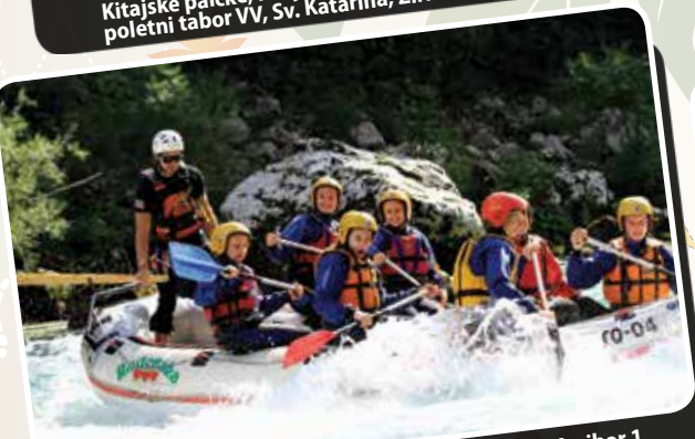
Z raftom namesto peš, potovalni tabor, Soča, Maribor 1