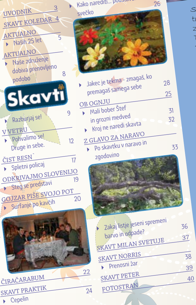
Slika na naslovnici: Marmelada 2014

Tiskovino Skavtvič izdaja Združenje slovenskih katoliških skavtinj in skavtov, Ulica Janeza Pavla II. 13, SI-1000 Ljubljana, tel.: 01 433 21 30, 0590 27 200, GSM: 031 210 944, 040 429 456 Sofinancira: Ministrstvo za izobraževanje, znanost in šport - Urad RS za mladino.