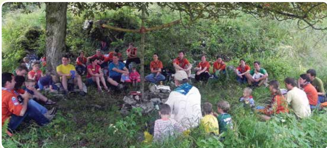
Svetišče na Skavtku

Sredi ruševin pod košatim divjim kostanjem je svet prostor. Tu je pod križem, po skavtsko narejenim iz dveh močnih palic, že večkrat bila sveta maša, za katero je oltar nastajal kar med mašo, iz kamnov, gradili pa so ga otroci.